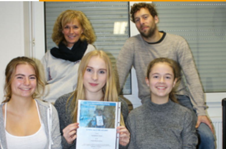
Die Sportlehrer und das Schülersprecherteam organisierten den Sponsorenlauf der Theodor-Mommsen-Schule.

Allen, die uns 2016 unterstützt und unsere Arbeit ermöglicht haben!