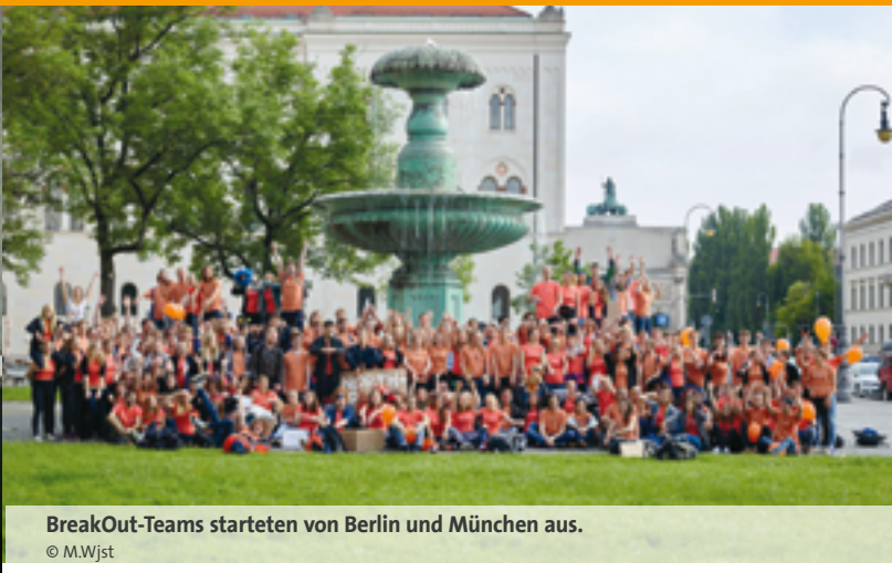
BreakOut-Teams starteten von Berlin und München aus.