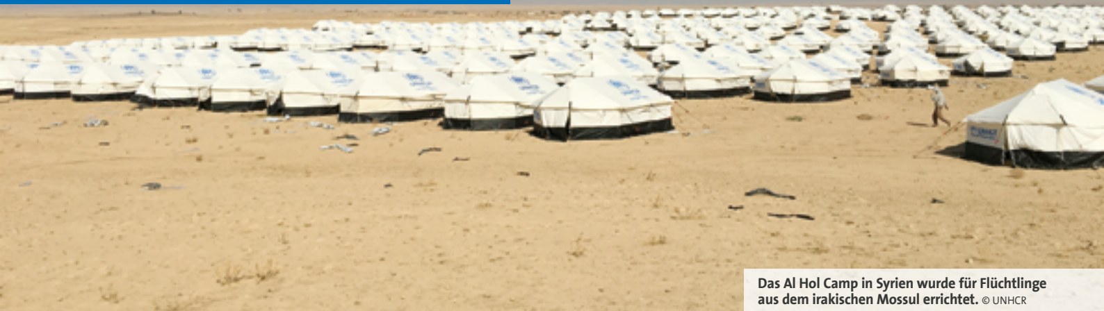
Das Al Hol Camp in Syrien wurde für Flüchtlinge aus dem irakischen Mossul errichtet.