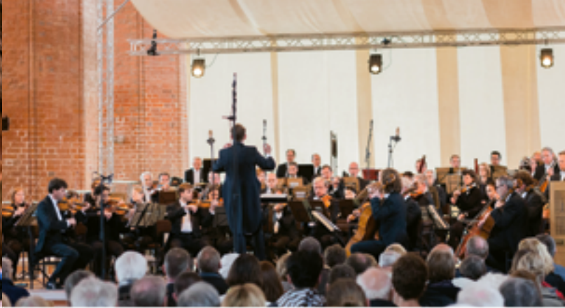
Die Mecklenburgische Staatskapelle begeisterte beim Benefizkonzert in Wismar.