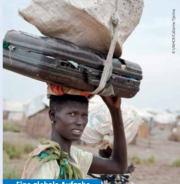
Eine globale Aufgabe